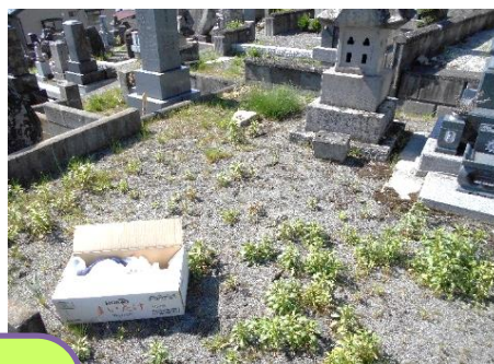
▲お墓の草取り、掃除