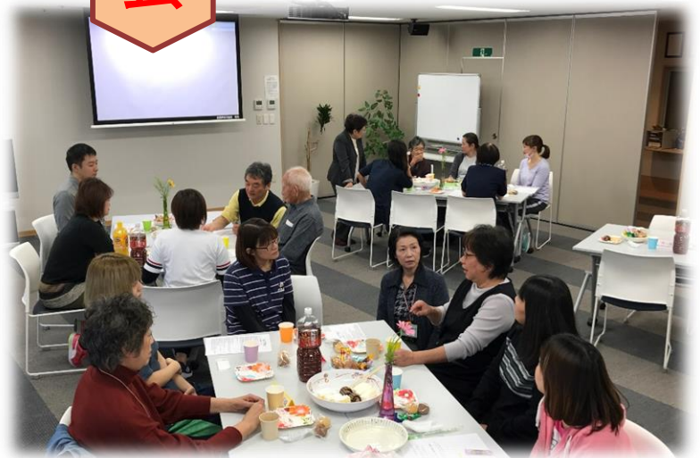
▲ご家族様と軽食を囲んで懇談

11月2日（土）は、ひろば特養の家族会でした。同じく多目的ホールにて、開催されました。ご家族との親睦が深められるように、毎年開催されています。限られた時間の中でしたが、職員が作成した動画を鑑賞しながら、入所者の普段の様子をお伝えすることが出来ました。