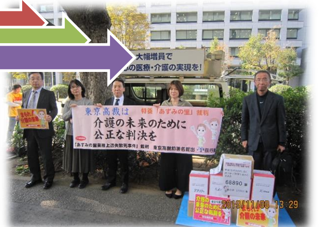
▲要請行動に参加した総務部長

11月8日（金）午後1時30分から、東京高等裁判所の門前にて、「食事介護にあっていた看護師の注意義務違反による『業務上過失致死』」を不服とする控訴審において無罪を勝ち取るための第2次要請行動が行われ、全国から持ち寄られた署名6万8890筆を提出しました。