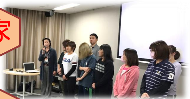
▲紹介される特養の職員

▲グループホームの家族会で挨拶する理事長 11月9日（土）グループホームの家族会が、ひろばの多目的ホールで開催されました。今回は、茶話会形式で、大勢のご家族が参加されました。